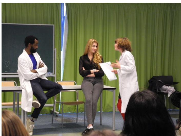
Pièce de théâtre forum Dérivée