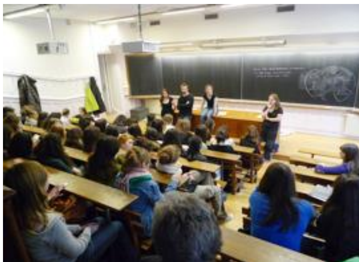
Discussion avec le public après la pièce et avant le forum